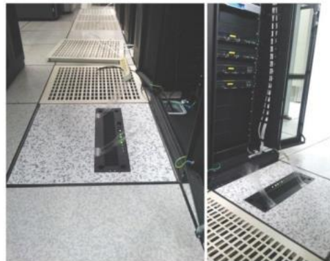
CAFS (CatchEye Access Floor System)